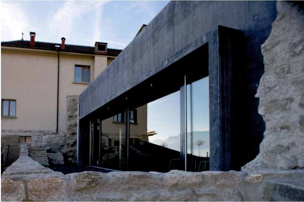
Face Sud du caveau