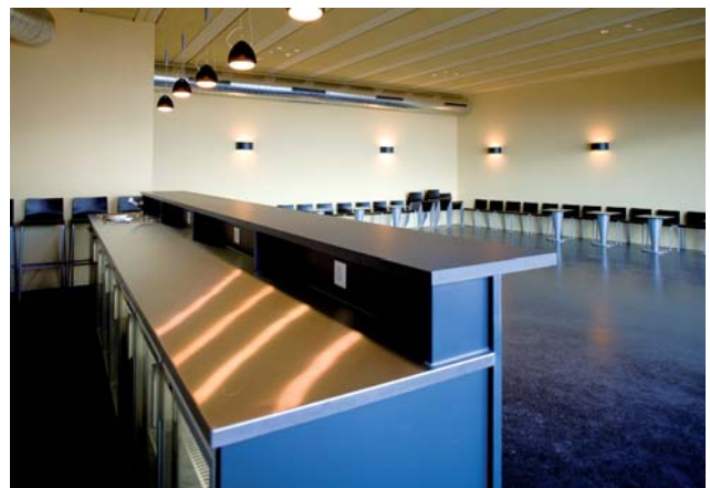
Caveau Corto vue du bar