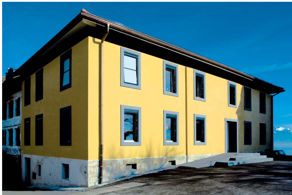
le logis du Monde angle Sud-Ouest