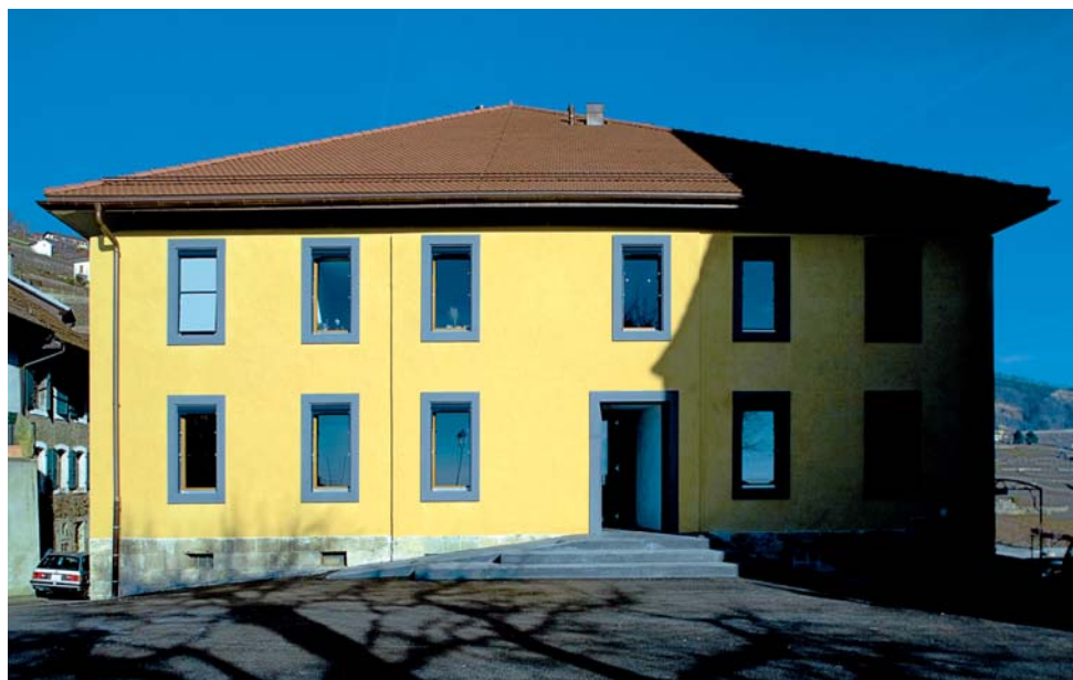
le logis du Monde depuis la place du village

Le projet prend une position claire sur le paysage architectural du lieu, pouvant être qualifié de "retour synonyme de tradition" par une architecture simple et consistante. Cette simplicité n'exclut pas des ponctuations contemporaines par un traitement sobre des façades, une toiture épurée, sans percement et une place du village traitée de façon unitaire mettant en scène l'ensemble des éléments bâtis.