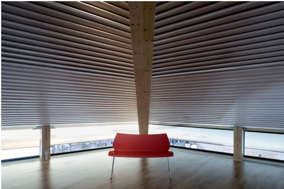
Salle des Combles du Logis

Sentiment renforcé par une délimitation de la place en rapport à la route du village par un seuil de pavés surélevés, obstacle psychologique pour les automobilistes invités à parquer leur voiture ailleurs. Seuls quelques bancs mobiles, sous le vent, bougent de plaisir, balancent et s'inclinent nonchalamment dynamisant cet espace central de la vie villageoise. L'ancien Hôtel du Monde, demeure plus que séculaire, doit retrouver un caractère simple de ses volumes et façades.