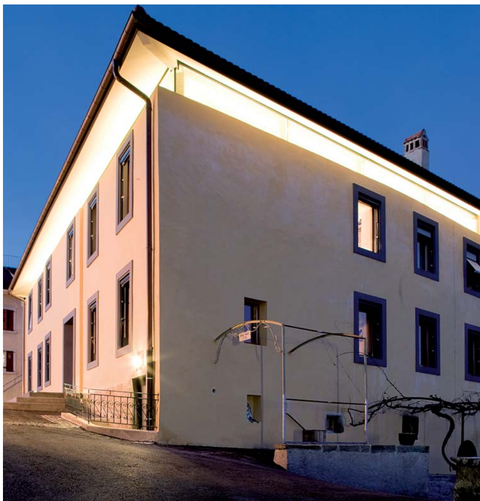
Vue nocturne du logis à l'angle Sud-Est

FICHE TECHNIQUE & ARCHITECTURE