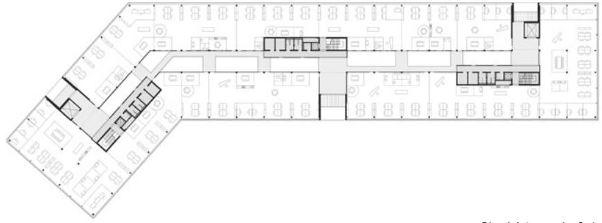
Plan bâtiment A - 3 e étage

RÉALISATION > Construits en deux ans, de 2019 à 2021, les bâtiments COPERNIC sont équipés de systèmes de ventilation et de refroidissement performants. La pose de panneaux solaires en toiture contribue à maximiser l'efficacité énergétique de l'ensemble. Le bâtiment A présente à l'extérieur une image uniforme par le travail particulier des bandes vitrées et pleines en bardage métallique perforé gris-clair qui apporte de la vibration sur toute la longueur. Des touches rouge vif pour les trois grandes loggias et les entrées du bâtiment dynamisent la façade. Pour le bâtiment C, composé de deux corps qui s'imbriquent, l'enveloppe exprime les fonctions accueillies dans les murs. Les façades de la partie réservée aux espaces de services sont en béton alors que celles de la partie destinée aux espaces d'activité sont revêtues de bardage métallique anthracite. Bien que distincts par leur expression architecturale, les deux bâtiments visent une même finalité, soit offrir des espaces performants et flexibles pour les entreprises souhaitant s'installer dans cet écosystème créé pour stimuler l'innovation.