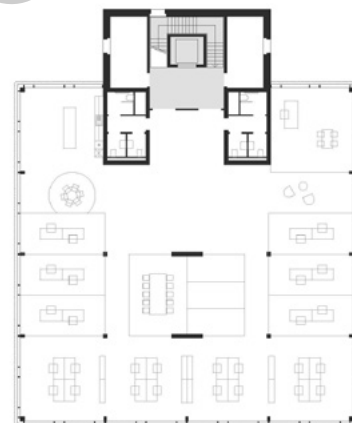
Plan bâtiment C - 3 e étage