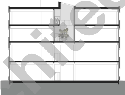
Plan de coupe bâtiment A