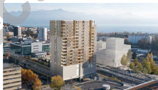
Malley Phare à Prilly est la première tour en structure bois de Suisse romande avec façades actives en photovoltaïque.

« Il faut vivre avec son temps, utiliser les nouvelles technologies, mais sans renier la base, le passé. »