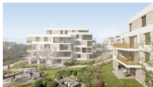
Le futur quartier résidentiel Ley Outre à Crissier est composé de 5 bâtiments implantés dans un tapis végétal.