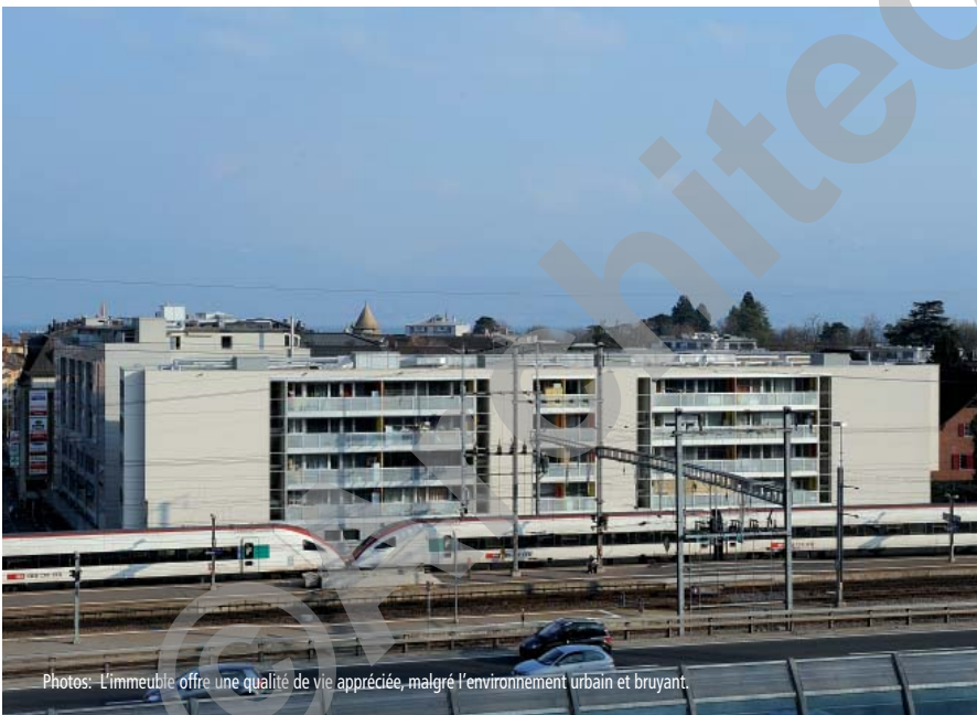
Photos: L'immeuble offre une qualité de vie appréciée, malgré l'environnement urbain et bruyant.

Les aménagements intérieurs comportent des finitions habituelles correspondant au standard de la location, notamment pour les sols; revêtus de parquets et de carrelages.