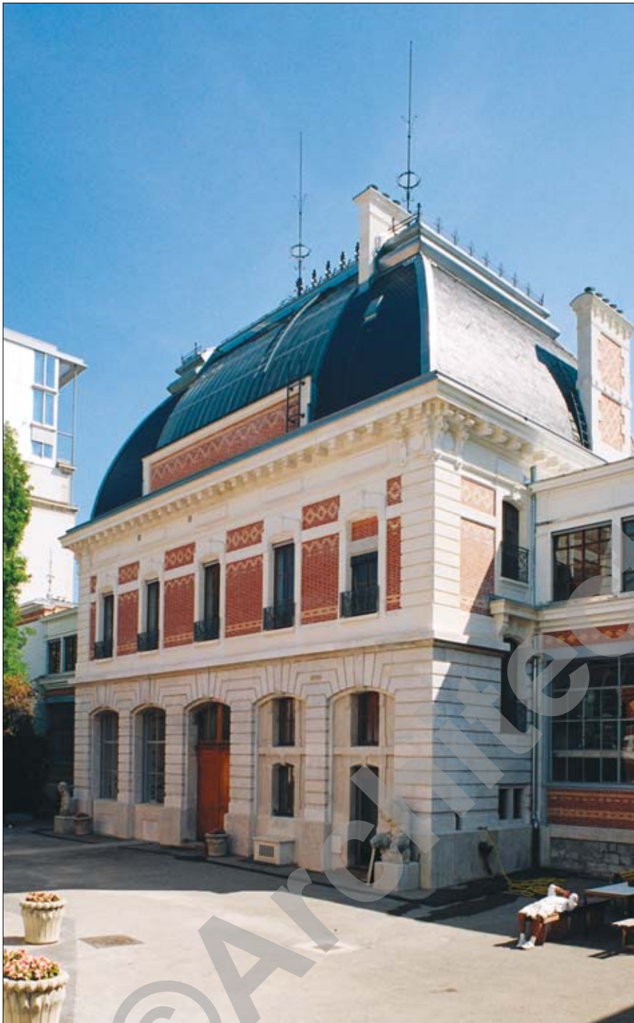
Façades et toitures avant rénovation