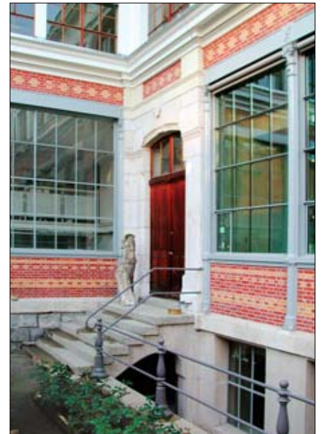
Façades et toitures après rénovation