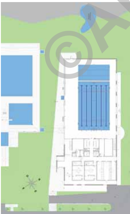
Plan du rez-de-chaussée et aménagements extérieurs

De plus, un projet de réaménagement des rives du lac a été réalisé en 2007. La nouvelle piscine s'inscrit donc dans un contexte plus général de définition et de développement de la zone de bord de lac d'Yverdon-les-Bains.