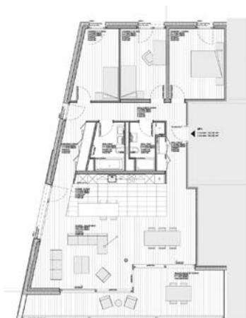
Rez supérieur, étage 1 et 2, type E

Conscient de la grande qualité du site inscrit dans un paysage boisé, avec une vue exceptionnelle sur le lac et dans un quartier résidentiel calme, le bureau d'architectes a porté une grande attention au choix des matériaux. Le projet est composé de deux volumes qui s'imbriquent. L'un compact est ancré au sol. Le second est suspendu sur la façade Sud. Il s'élanche sur le lac et contient les loggias. Sobre, le bâtiment est pensé avec un code couleur et des textures simples en harmonie à l'intérieur et à l'extérieur. L'élégance de la pierre naturelle claire choisie en façade Sud contraste avec la couleur brun chocolat du crépi fin au Nord. Des séparations de balcons en bois et des garde-corps en verre créent le rythme de la façade Sud. Le gris aluminium/inox pour les menuiseries en bois-métal, la serrurerie et les stores à lamelles.