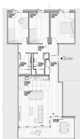
Rez supérieur, étage 1 et 2, type D