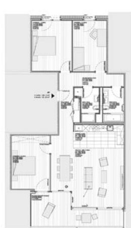
Rez supérieur, étage 1 et 2, type C