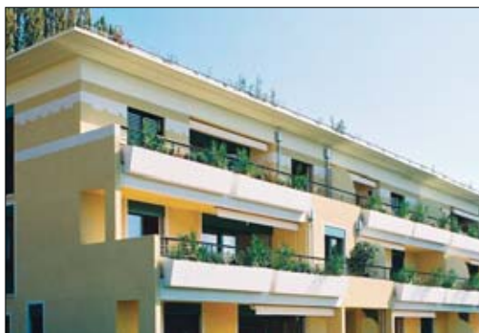
Image précise et typée, identifiant fortement le projet et les habitants à ce dernier: l'excellence de la conception s'ajoute à celle de la réalisation.