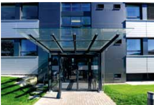
Entrée du personnel

Des équipements audio-visuels de la dernière génération ont été installés dans ces espaces de conférence et de formation. Une cafétéria colorée avec équipement de cuisine-collation a été conçue au 2ème étage pour le personnel. Enfin l'appartement du concierge a été entièrement rénové.