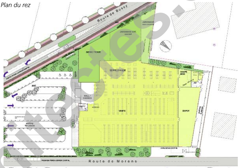
Plan du rez

Cette solution contribue grandement à l'augmentation de l'éclairage naturel dans les locaux, tout en favorisant une excellente perception de l'espace intérieur. Construit en neuf mois et demi seulement grâce à une coordination optimale du projet et de l'exécution, ce nouveau centre Brico-Loisirs présente une conception et des systèmes simples à construire et à gérer. C'est là un des éléments les plus remarquables de cette réalisation qui s'inscrit exactement dans la ligne définie par le Maître de l'ouvrage, réputé par ailleurs exigeant.