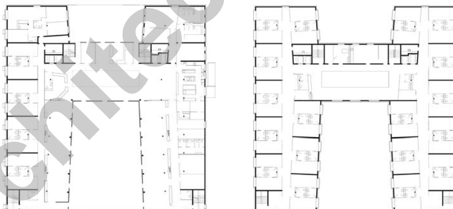
Etages 1 et 2