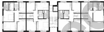
Plan du 1er étage