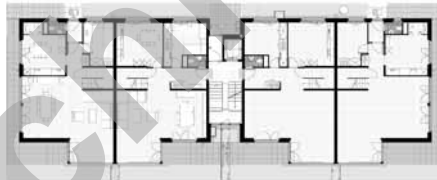
Plan du rez-de-chaussée