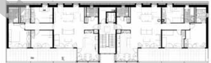
Plan de l'attique