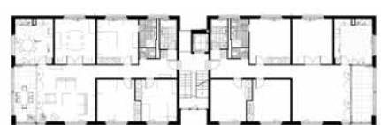
Plan du 2ème étage