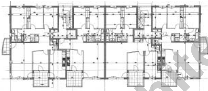
Plan du 1er étage

Prix total (sans le terrain) : CHF 6'405'000.-