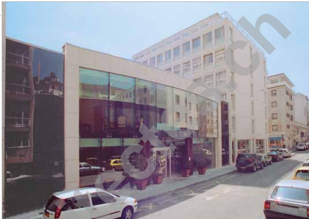
Vue de l'entrée