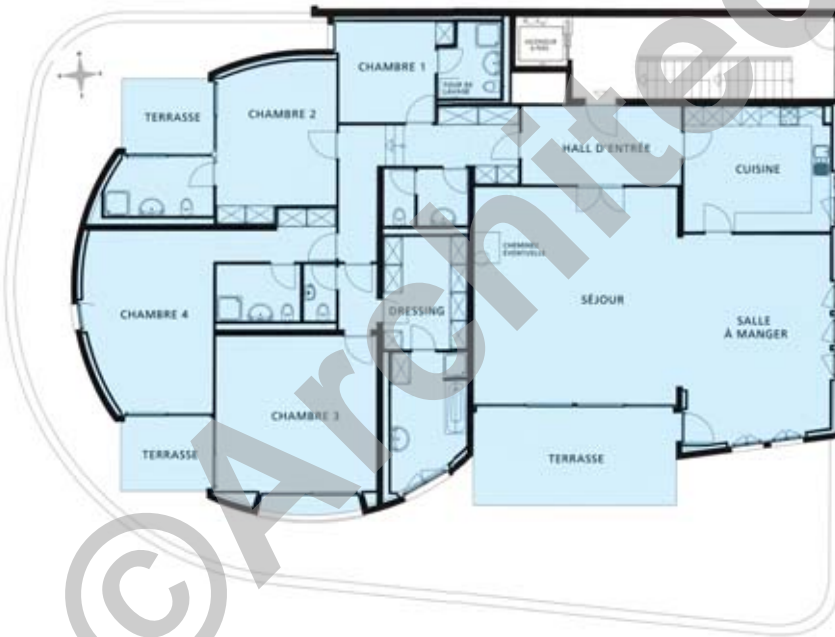
“Le Grand Large” Rez-de chaussée

Ces logements ont été conçus, dans un standard élevé, pour être soit vendus soit mis en location.