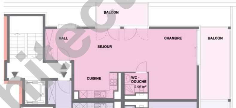
Bâtiment J3, attique, 2 1/2 pièces