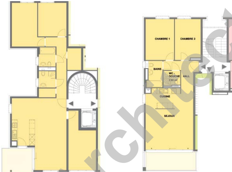
Bâtiment F, appartement 41/2 pièces