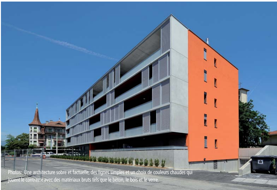
Photos: Une architecture sobre et factuelle, des lignes simples et un choix de couleurs chaudes qui jouent le contraste avec des matériaux bruts tels que le béton, le bois et le verre.