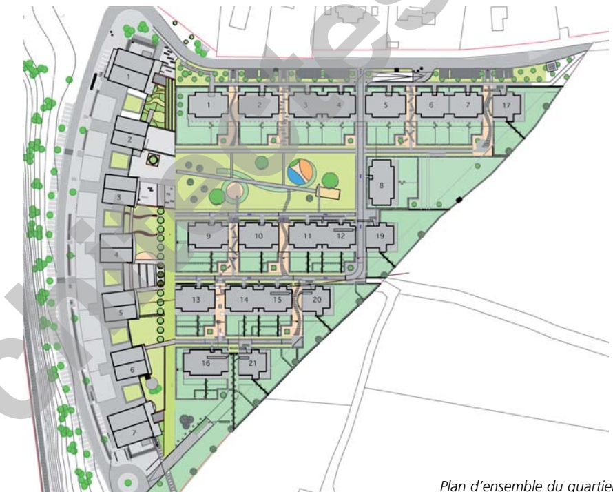
Plan d'ensemble du quartier

Compte tenu de leur destination et du standard voulu pour l'ensemble de ce développement, les immeubles sont réalisés au moyen de matériaux et de modes constructifs de qualité élevée, garantissant à long terme une valeur d'investissement d'excellent niveau, ajoutée à des caractéristiques spatiales internes et externes, voulues dès l'abord, hors des usages courants actuellement.