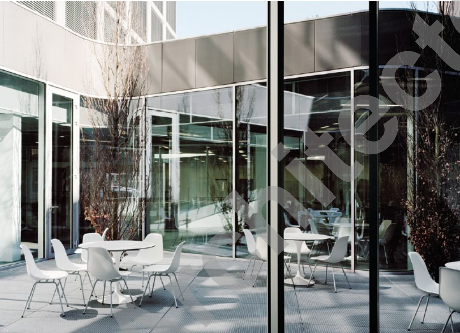
Photos La nouvelle composition du site permet de l'affirmer de façon claire et cohérente en exprimant les fonctions de tous les éléments.