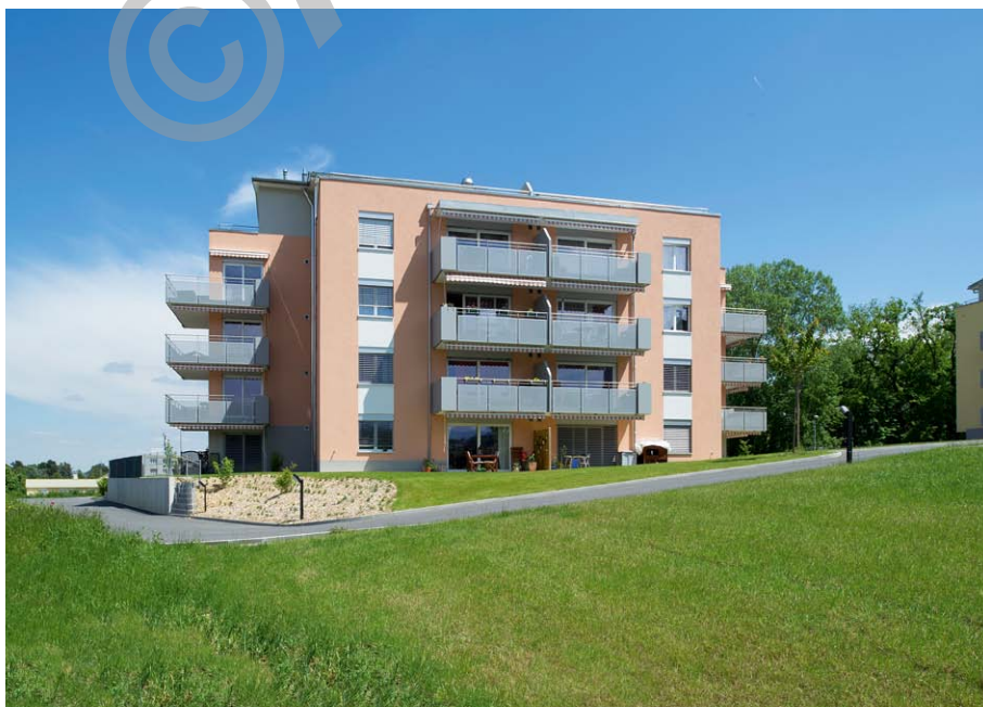
D2 - "Les Pinsons"

Cette étape clôt le grand projet "En Plamont" qui propose 219 appartements dans un quartier calme et verdoyant, proche des grands axes routiers et de la ville d'Orbe.