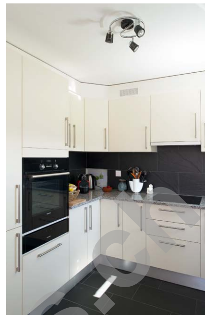
Séjour et cuisine - "Les Lavandines"