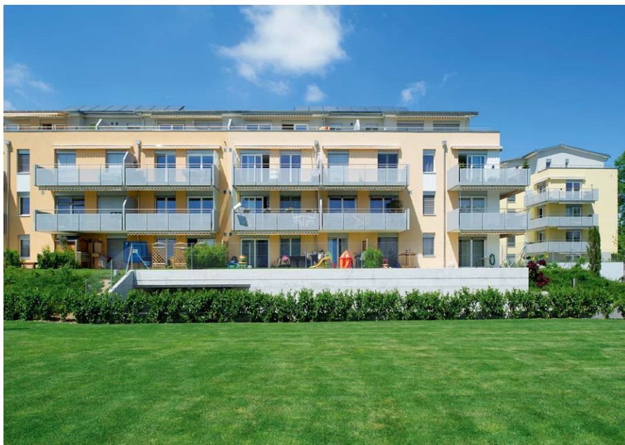
D3 - "L'Orangerie"