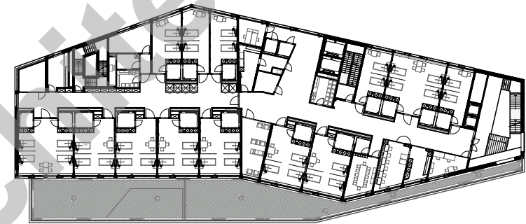
1 er étage