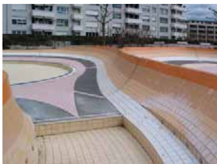
Bassins avant travaux

La piscine extérieure comporte deux bassins, l'un rectangulaire de 25 par 12,5 m et l'autre circulaire, de 8 mètres de diamètre et de faible profondeur destiné aux petits-enfants. L'aspect principal du projet est la réalisation d'un parcours constitué de dalles de 180 par 180 cm en béton préfabriqué passant entre les deux bassins et reliant la piscine intérieure à l'aire engazonnée; les accès aux pédiluves y sont connectés. Tous les obstacles et les différences de niveau sont gommés rendant possible une déambulation sans barrière architecturale. La façade longitudinale vitrée de la piscine intérieure est dégagée d'une série de plantations, donnant une relation visuelle entre l'intérieur et l'extérieur et révélant une nouvelle échelle à l'ensemble du site.