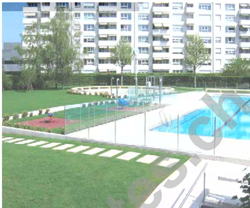
Vue après travaux

a été complètement changé assurant la vitalité des pelouses pendant les fortes affluences estivales. La création d'un terrain de beach-volley met à profit une zone, autrefois, peu utilisée et, offre une activité sportive supplémentaire.