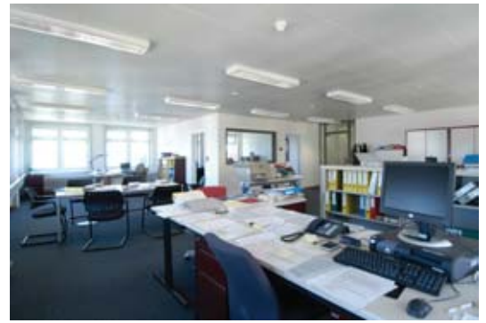
Office des transports

S'ajoutent à ces mesures, celles qui permettent de rendre ces espaces aptes à leurs nouvelles fonctions. Le rez se voit pourvu de plafonds suspendus en panneaux de plâtre, favorisant une bonne ambiance acoustique, tandis que le premier étage conserve ses plafonds d'origine. Au deuxième, on a procédé au renforcement de l'isolation thermique, au droit des parties qui sont directement en contact avec les combles.