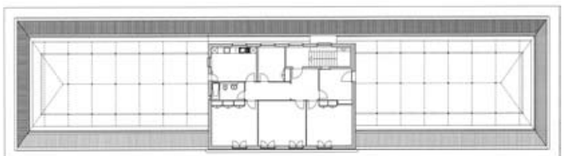
Plan des combles