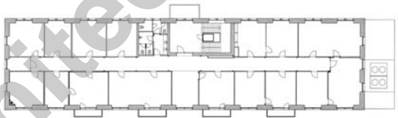
Plan du 1er étage