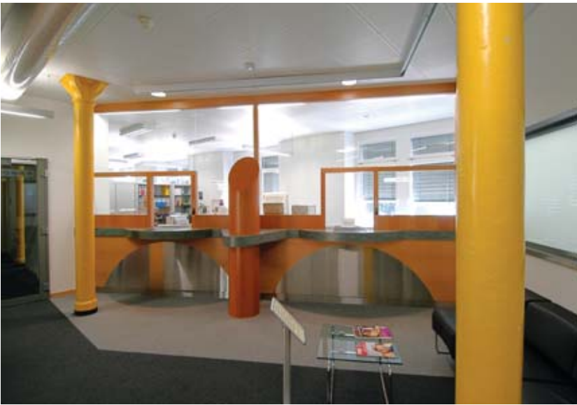
Office des poursuites du Littoral et du Val-de-Travers