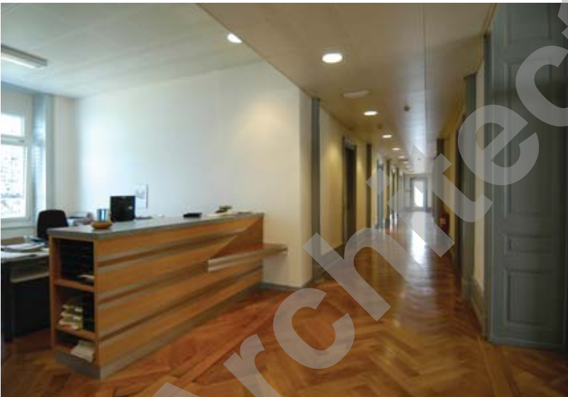
Service de l'aménagement du territoire

L'accès des personnes handicapées et la livraison du matériel encombrant sont désormais assurés par un monte-charge extérieur, les alentours du bâtiment étant par ailleurs réadaptés, notamment par l'adoption d'un tracé d'entrée partiellement nouveau et par diverses interventions dans le parc arborisé.