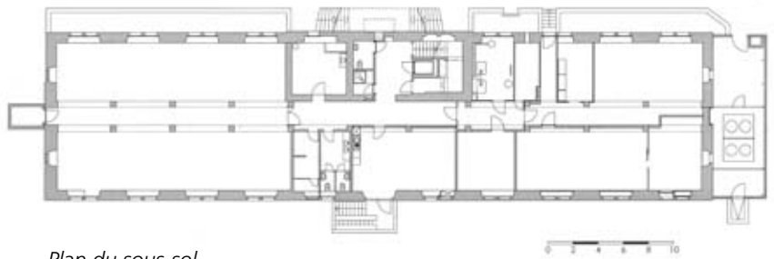
Plan du sous-sol