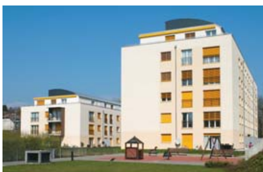
Image nette et claire pour des logements voulus agréables à vivre: les habitations HLM d'aujourd'hui répondent à des critères de conception et de réalisation sans commune mesure avec les premières réalisations du genre.