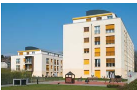
Image nette et claire pour des logements voulus agréables à vivre: les habitation HLM d'aujourd'hui répondent à des critères de conception et de réalisation sans commune mesure avec les premières réalisations du genre.