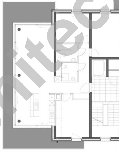
Appartement type Rez