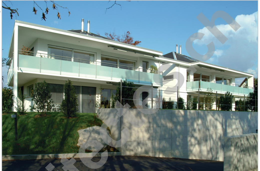
L'architecture privilégie les surfaces vitrées pour un apport maximal de lumière naturelle