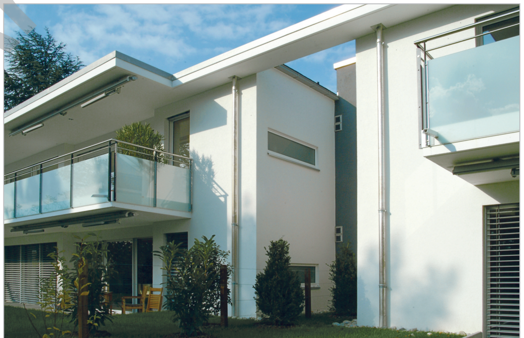
Le concept scinde le bâtiment en deux corps symétriques

parking souterrain qui dessert également les locaux techniques, buanderies et caves privatives pour les appartements de l'étage. ▶