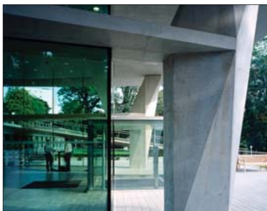
Image contemporaine et novatrice. Les deux auditorios de 100 places et une quinzaine de salles d'étude