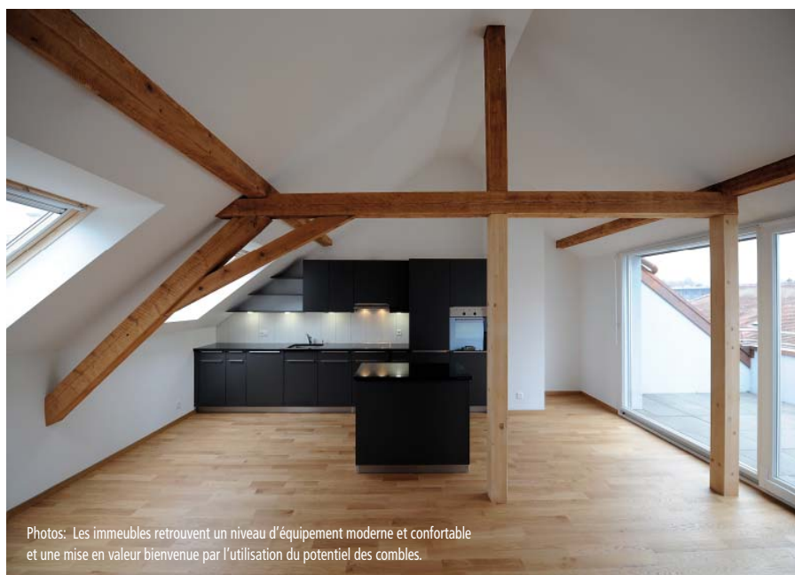
Photos: Les immeubles retrouvent un niveau d'équipement moderne et confortable et une mise en valeur bienvenue par l'utilisation du potentiel des combles.