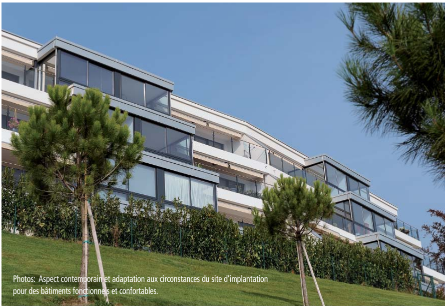
Photos: Aspect contemporain et adaptation aux circonstances du site d'implantation pour des bâtiments fonctionnels et confortables.