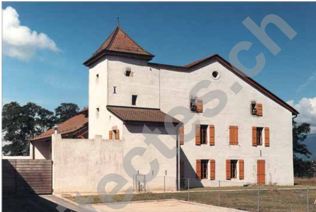
Ferme et Château