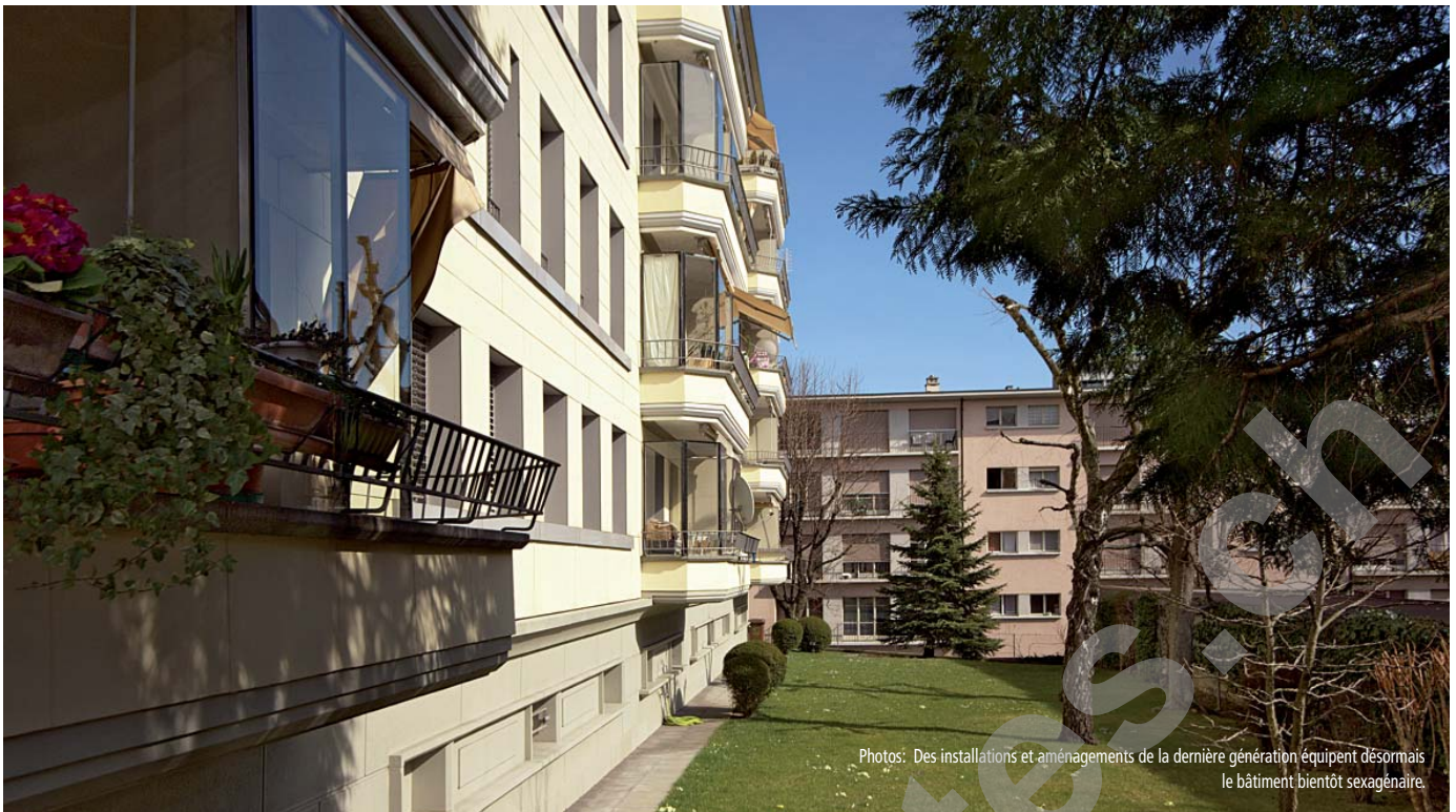
Photos: Des installations et aménagements de la dernière génération équipent désormais le bâtiment bientôt sexagénaire.

Les ascenseurs existants sont remplacés, les couloirs et les halls d'appartements sont complètement rénovés et les portes palières remplacées par des portes EI 30, équipées d'une fermeture tribloc.