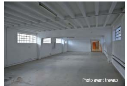
Photo avant travaux

affectation, la toiture est isolée et étanchée, les façades reçoivent une isolation périphérique, polystyrène et laine minérale sur zone courives.