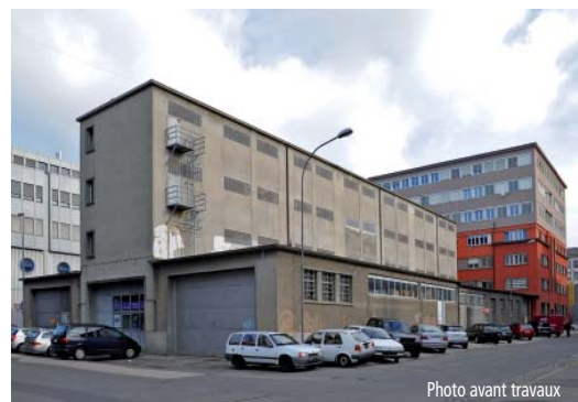
Photo avant travaux