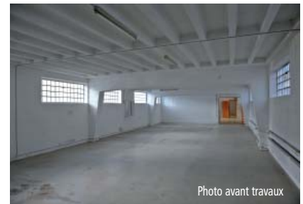
Photo avant travaux

affectation, la toiture est isolée et étanchée, les façades reçoivent une isolation périphérique, polystyrène et laine minérale sur zone courives.