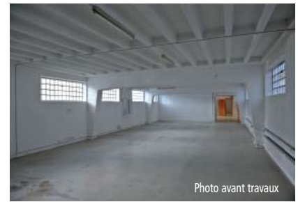
Photo avant travaux

affectation, la toiture est isolée et étanchée, les façades reçoivent une isolation périphérique, polystyrène et laine minérale sur zone courives.