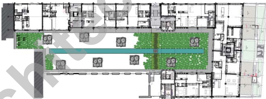
Plan du rez supérieur