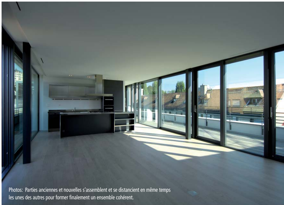
Photos: Parties anciennes et nouvelles s'assemblent et se distancient en même temps les unes des autres pour former finalement un ensemble cohérent.