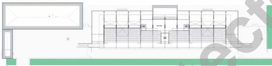
Plan du 1er étage

L'ensemble du projet va donc à la rencontre d'un programme exigeant sous plusieurs aspects, intégration, architecture, réserve d'évolution, image marquante et satisfaction aux attentes sportives aussi bien que politiques.