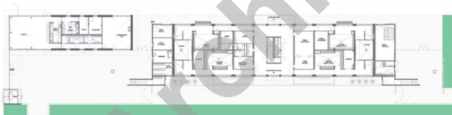
Plan du rez-de-chaussée