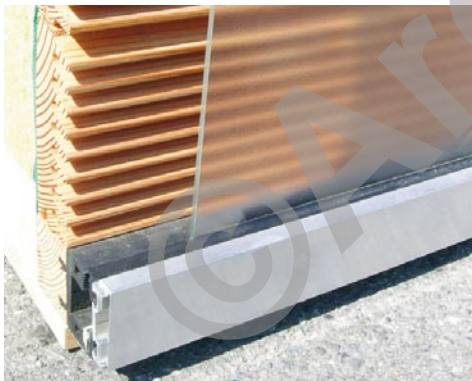
Détail façade « Lucido »