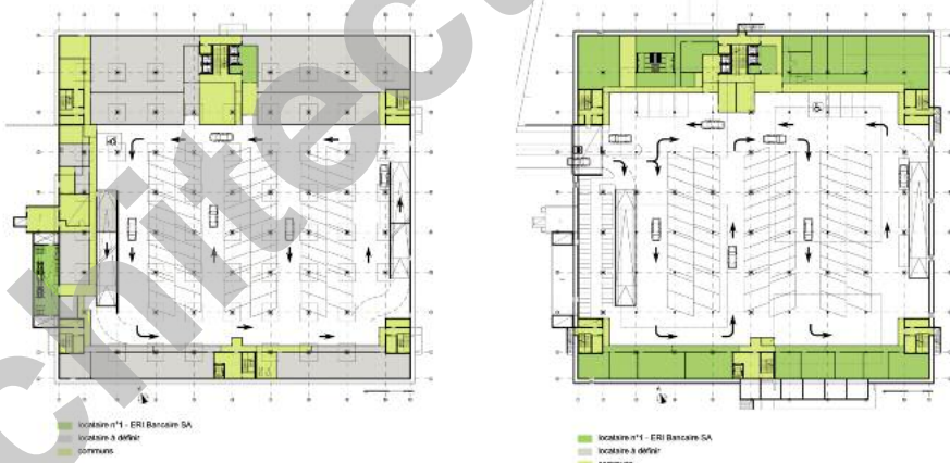
Plans du 2ème et 1er sous-sol

Les éléments de verre, d'aluminium, et d'aluminium perforé gris animent les façades ponctuées de meneaux rouges, disposés irrégulièrement et éclairés de nuit. L'ensemble présente ainsi une physionomie vivante et gaie qui contrebalance la rigueur du concept général. Les patios intérieurs sont conçus sur le même mode, reprenant à la fois l'expression et le système constructif à double peau, essentiellement retenu en raison de ses propriétés phoniques.