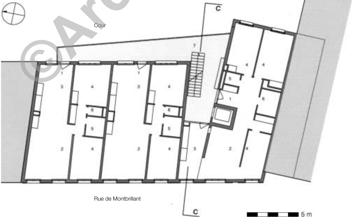
Plan étages 1 à 3