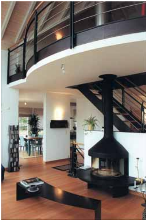
Cheminée et galerie sur séjour

La cheminée en métal noir s'adosse à l'escalier. Le coin repas et la cuisine ont été prévus à l'Ouest pour bénéficier des derniers rayons du soleil couchant. La cuisine est ouverte sur le coin repas. Son plan de travail en granit gris-rose se marie au mieux avec le sol en cerisier.