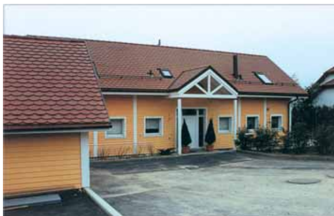
Côté cour et entrée

Le salon entièrement ouvert jusqu'en toiture et à l'Est; au Sud et à l'Ouest, séparé de la nature que par la construction de grandes baies vitrées. ▷