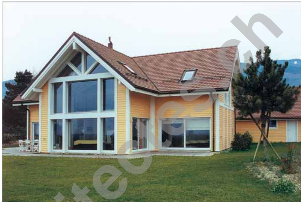
Grandes baies vitrées au Sud

Charles Hauswirth Grand-Rue 1183 Bursins