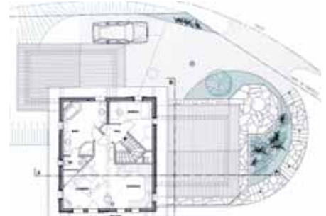
Plan de l'étage