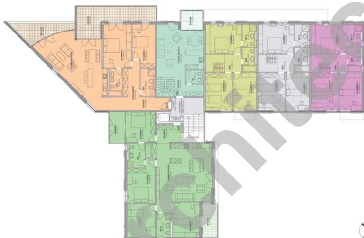
Bâtiment G, niveau 2

D'allure semblable, les deux bâtiments projettent une image adaptée à leur situation sur le site et réservent des aménagements intérieurs nettement différenciés.