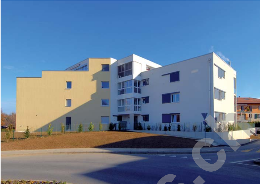
Bâtiments G et H, niveau 1

Les façades de front, orientées vers le giratoire voisin et la voie CFF, présentent des vitrages fixes et des vérandas qui peuvent, le cas échéant, être transformées en chambres.