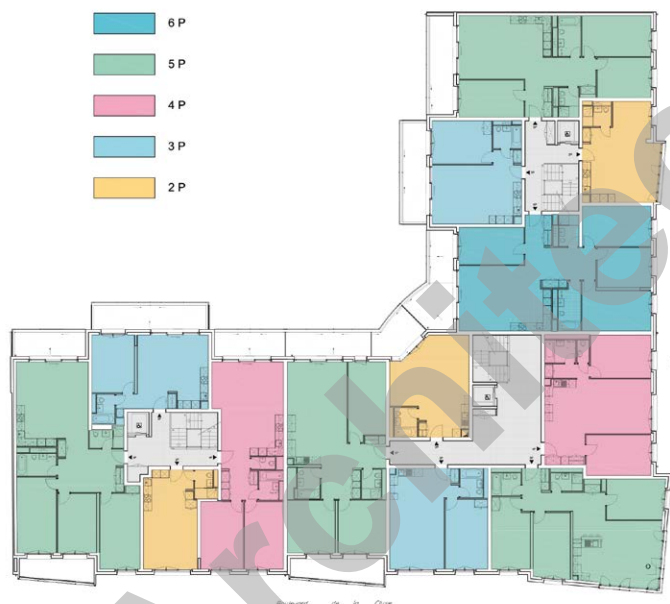
Plan d'étage type

Les menuiseries extérieures en bois/aluminium ont de hautes performances d'isolation phonique et thermique.