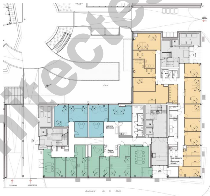
Plan du rez-de-chaussée