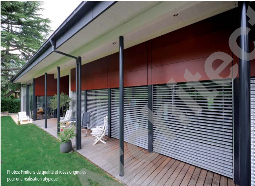
Photos: Finitions de qualité et idées originales pour une réalisation atypique.

Garages et atelier sont également réalisés en éléments préfabriqués monolithiques. En façade, on a appliqué des panneaux stratifiés en bois à haute densité pour l'extérieur, de type Parklex.