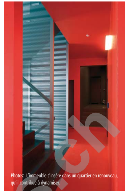
Photos: L'immeuble s'insère dans un quartier en renouveau, qu'il contribue à dynamiser.