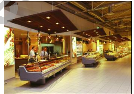
Vues intérieures surfaces commerciales coop