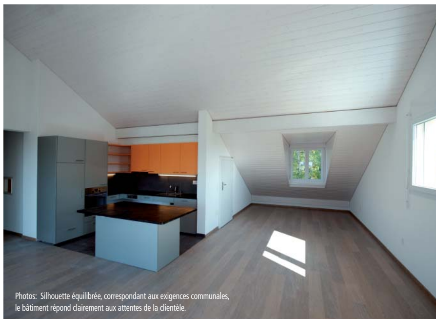
Photos: Silhouette équilibrée, correspondant aux exigences communales, le bâtiment répond clairement aux attentes de la clientèle.