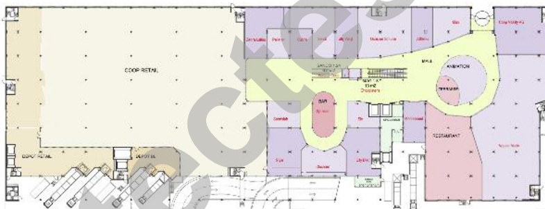
Plans du rez-de-chaussée et 1er étage