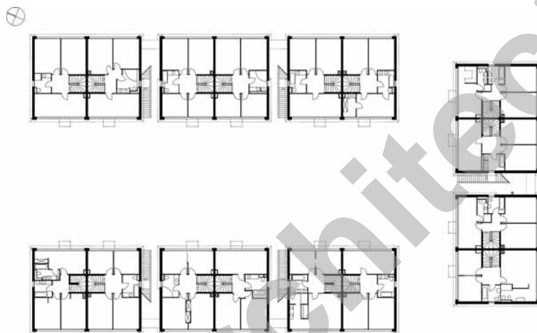
Plan des étages

Ce dernier est poursuivi visuellement à l'extérieur par une marquise métallique qui incorpore les stores à lamelles et les stores toiles, permettant de réguler l'afflux de lumière naturelle.