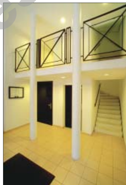
Entrée de l'immeuble rue de la Flèche no 5