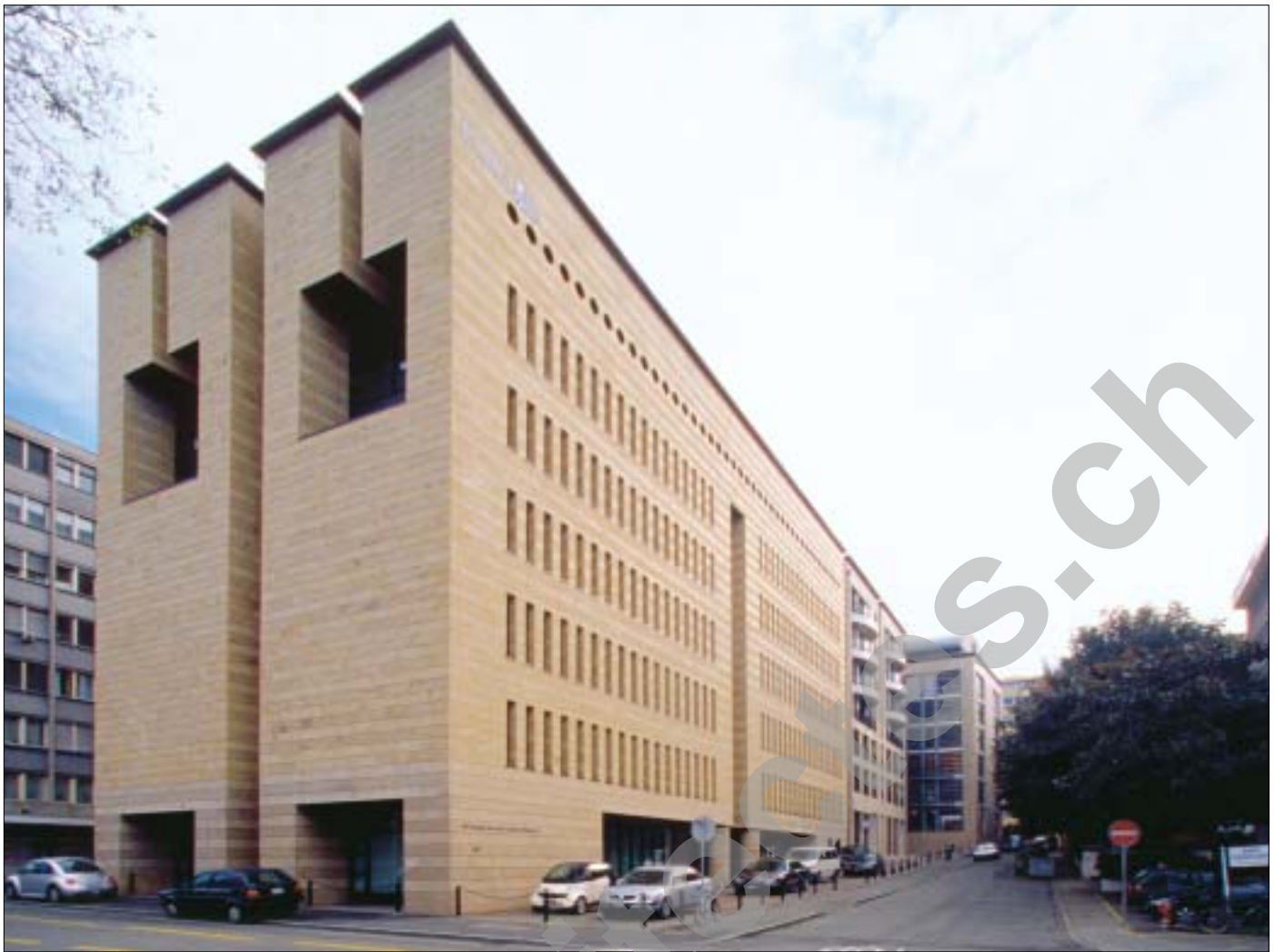
Vue d'ensemble Ilot Terrassière