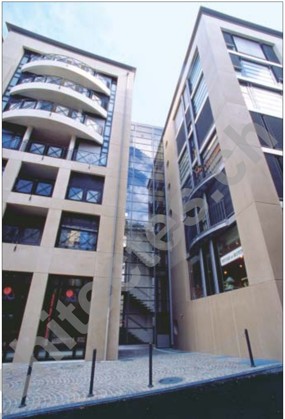
Escalier d'accès immeuble Terrassière no 23

Les solutions retenues pour la réalisation du projet englobent le traitement des aménagements extérieurs, eux aussi largement conditionnés par les exigences de la Ville. Celle-ci ayant pour intention de redéfinir la circulation motorisée dans le secteur, en réservant un espace séparé pour les transports publics, les concepteurs se sont trouvés dans l'obligation de régler trois des façades par rapport à leur juxtaposition avec le domaine public. Seul l'accès au noyau des distributions verticales restait à aménager pour obtenir une cohérence de niveaux et de traitement, notamment sur le plan des matériaux choisis, soit, dans le cas particulier, des pavés de grès porphyre.