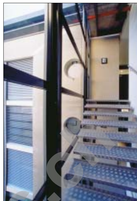
Escalier d'accès aux étages Terrassière no 23