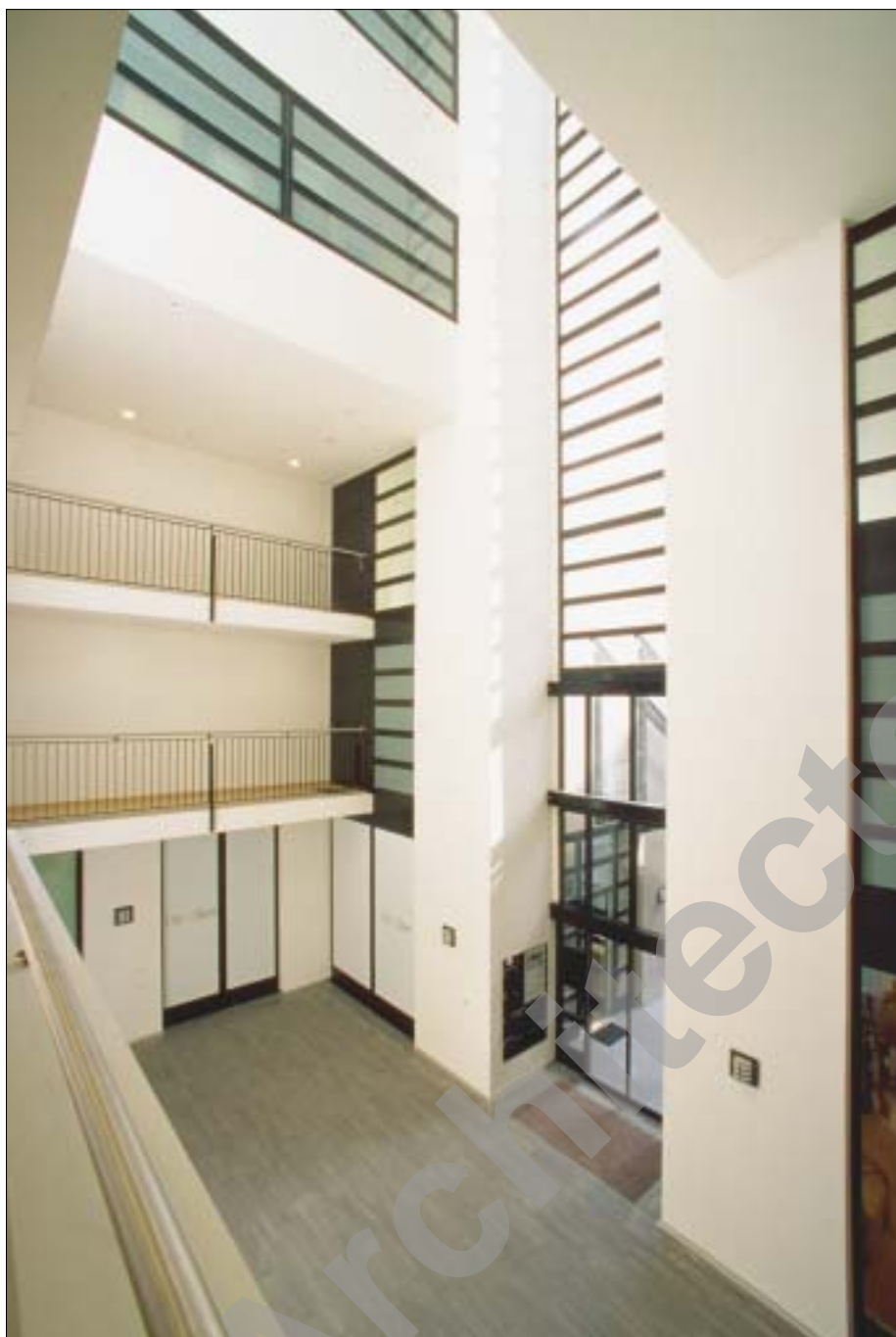
Cour intérieure de l'immeuble Terrassière no 23