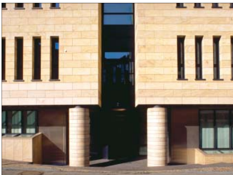
Entrée de ING-BBL