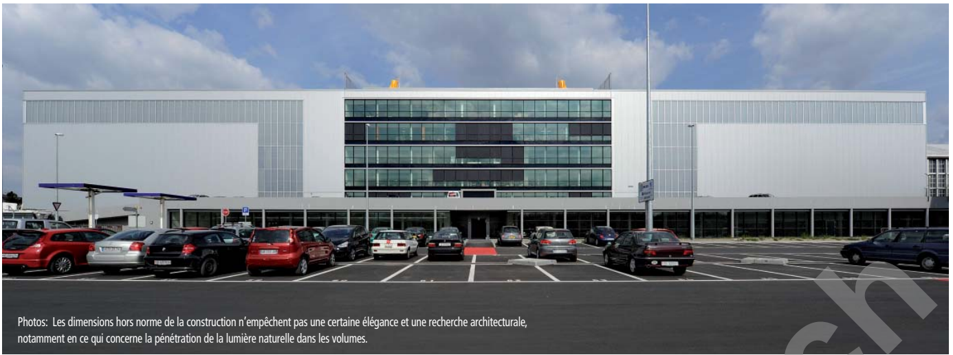
Photos: Les dimensions hors norme de la construction n'empêchent pas une certaine élégance et une recherche architecturale, notamment en ce qui concerne la pénétration de la lumière naturelle dans les volumes.

Après 15 ans pour faire aboutir le projet, moins de 24 mois se sont écoulés entre la démolition des maisons sur site (deux villas et des baraquements provisoire avec relogement des familles) et la remise du bâtiment à Geneva Airpark, ceci malgré les contraintes considérables qui sont venues s'ajouter à celles de la gestion d'un chantier d'une telle ampleur :